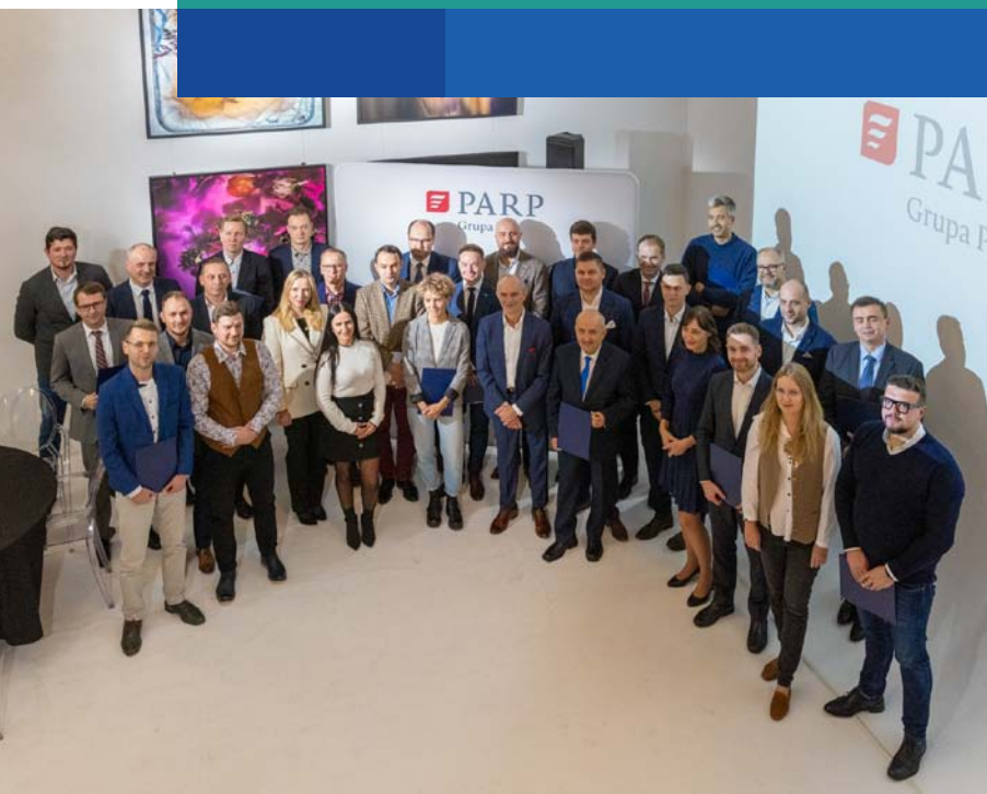
Laureaci konkursu na najlepsze rozwiązania gospodarki obiegu zamkniętego

PARP wyróżniła 24 rozwiązania, które najlepiej przyczyniają się do transformacji przedsiębiorstw w kierunku gospodarki obiegu zamkniętego.