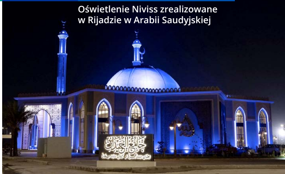
Oświetlenie Niviss zrealizowane w Rijadzie w Arabii Saudyjskiej

z Programu Operacyjnego Inteligentny Rozwój. Pieniądze zostały przeznaczone zarówno na prace badawczo-rozwojowe, jak i na zakup nowej linii montażowej opraw oświetleniowych.